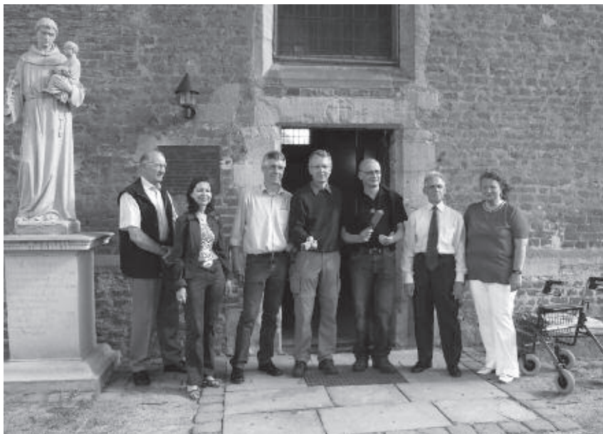
Vor der Kreuzkapelle Dülmen