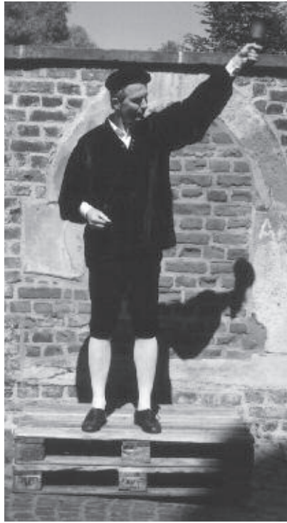
Der Marktvogt eröffnet die Siechenkirmes

Zu den Kirchweihfesten der Kinderhauser Leprosengemeinschaft war noch im 17. Jahrhundert stets auch Besuch aus Rat und Verwaltung der Stadt Münster gekommen. In den Ausgabenrechnungen der Stiftung Kinderhaus heißt es für das Kriegsjahr 1638, als wegen des Dreißigjährigen Kriegs die sonst übliche Fahrt von Bürgermeister, Stadtsekretär und Ratsherren ausfiel „... alß meine großgepietende herrn Provisorn mit herrn bürgermeistern,