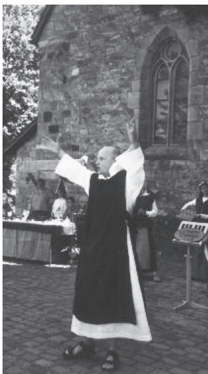
Ein Mönch wettet gegen das Kirmestreiben

Wegen des großen Aufwands mehrwöchiger Vorbereitungen kann die Siechenkirmes zunächst keine jährliche Wiederholung finden. Aber es wird voraussichtlich in durchaus