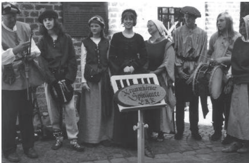
Die Krummhörner Spielleute aus Emden

Stiftung Kinderhaus bewahrt und entwickelt hatten.