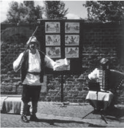
Der Moritatensänger

nicht allzu fern Zukunft wieder eine Siechenkirmes Kinderhaus geben.