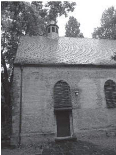
Kapelle des ehemaligen Leprahospitals Köln-Melaten