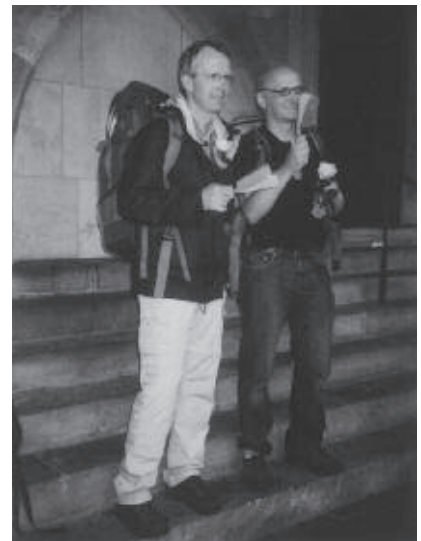
Zurück vor dem Rathaus in Münster, Foto: Petra Jahnke

Nach dem uns erneut spendierten Frühstück im Dülmener Bäckereicafé gingen wir mehrere Stunden durch Nieselregen. Es war noch nicht spät am Nachmittag, als wir Münster-Mecklenbeck und bei durchbrechender Sonne schließlich den Aaseitenweg erreichten. Mit verzögertem Schritt gelang es uns, die Zeit bis 18 Uhr zu strecken. Von einer treuen Gemeinde wurden wir vor dem Rathaus der Stadt Münster empfangen und konnten den Spendertrag unserer Fußreise vorzeigen: 750 Euro, davon 500 Euro für