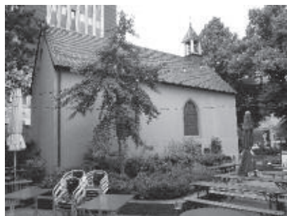
Die Siechenhauskapelle in Essen-Rützenscheid